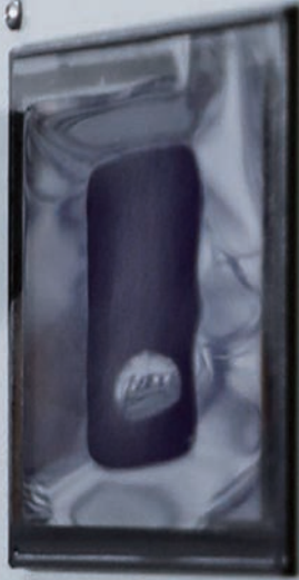
Affichage des défauts