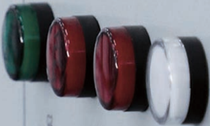
C2 Instructions de travail