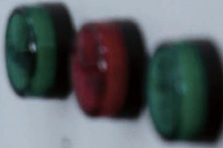
C1 Instructions de travail