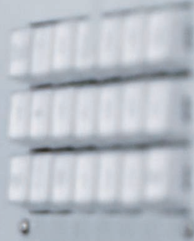
Boutons d'arrêt de urgence